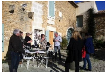
Cartographie participative à la Maison de la Garrigue de Marguerittes et dégustation dans le cadre de « Vignobles et Découverte » des Costières de Nîmes