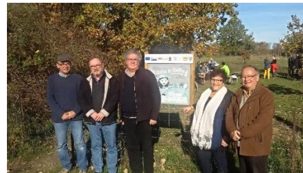
Inauguration des Jardins partagés de Tinelles à St Mamert du Gard et « Café Transmission » de l'ADDEARG : premiers projets soutenus dans le cadre de LEADER

Des projets de coopération autour de l'agritourisme et de la cartographie participative sont également à l'étude.